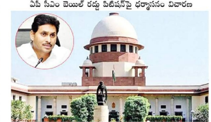
యదాద్రిపాది, హైదరాబాద్, 24 నవంబరు : ఏసీ సీఎం బెయిల్ రద్దు పిటిషన్పై ధర్మాసనం విచారణ రద్దుచేయాలని ఎన్డీ రద్దు రామకృష్ణ రాజు చేసిన మంగళాక్షయ్