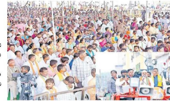
యదాద్రిపాది, నిజామాబాద్/రాజేంద్రవరగి/హైదరాబాద్, 24 నవంబరు : సీఎం కేసీఆర్ అవినీతిపై విచారణ చేయమని కేంద్ర హోం మంత్రి మంగళాక్షయ్