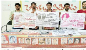
మనో నోటుకు మనం అమ్ముకుంటున్నామంటే భవిష్యత్తు అ నాయకులు పార్టీలలోనే అమెరికా పార్టీలలో వారందరినీ తెలుసుకుంటున్నారని చెప్పారు.

యదాద్రిపాటి, సెంట్రల్ టాకెట్, 24 నవంబర్: ఎన్నికల్లో రాజకీయ నాయకులు చూపే దుమ్ము ఎరకు ఆకటికే - మరో ఐదేళ్ల పాటు మొనరేవడం భావించిన జైలార్లలో ఒకటి ఖాసాబాబుల కమిటీ రాష్ట్ర ప్రధాన కార్యదర్శి అధిష్టాన సభ్యులారూ గౌరవం అందించారు. ఉత్తరవారి సెంట్రల్ జైల్లో కేసీఆర్ ప్రజాస్వామ్యవాది బద్దలు కొట్టడం ప్రజాస్వామ్యవాది నిలబెట్టడం. నోటుకు ఓటు అమ్ముకుంటే ఐదేళ్ల భవిష్యత్తు అధోగత. ప్రజాస్వామ్యవాది బద్దలు కొట్టడం ప్రజాస్వామ్యవాది నిలబెట్టడం.