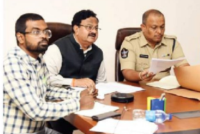
ధామ, తదితరాలు ఏర్పాటు, అలాగే సైట్ సృష్టి, ఫుడ్ సృష్టి, విద్యుత్ శాఖ నిలకరం ఏర్పాటు, తదితరాలు ఏర్పాటు, తదితరాలు ఏర్పాటు.