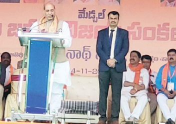
ఉడింగ్ జరుగుతుందని, తాను చేసిన సేవలు తనను అక్కడకే వెళ్లాలి తో గెలిచినప్పుడు దీమా వ్యక్తం చేశారు. బీఆర్‌ఎస్ కాంగ్రెస్ పార్టీలు ఒక్కటే ఉన్నాయి. మంత్రి మద్దాద్రి కర్ణాటక అంతే తనని అగ్రుం మంగళాక్షయ్